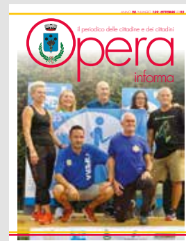
IN COPERTINA Opera Bandiera Azzurra 2023